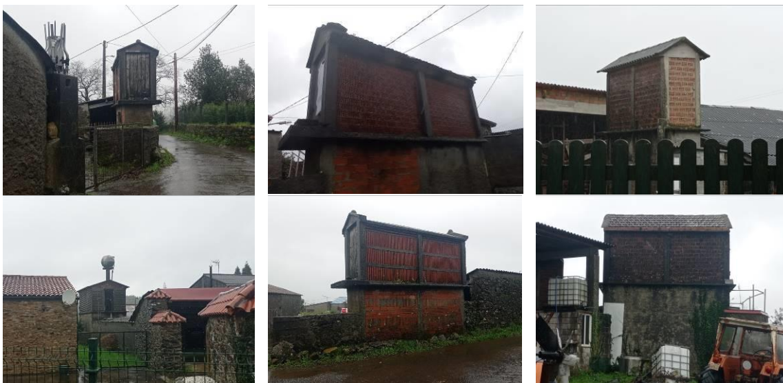
Hórreos de construción arredor dos anos 50, con estrutura de formigón, paramentos de ladrillo cerámico visto e cuberta con placas de fibrocemento vistas.

No tocante ós restantes hórreos modernos detectados e non catalogados, a continuación achéganse imaxes que xustifican a ausencia de características que merezan ser obxecto de especial protección.